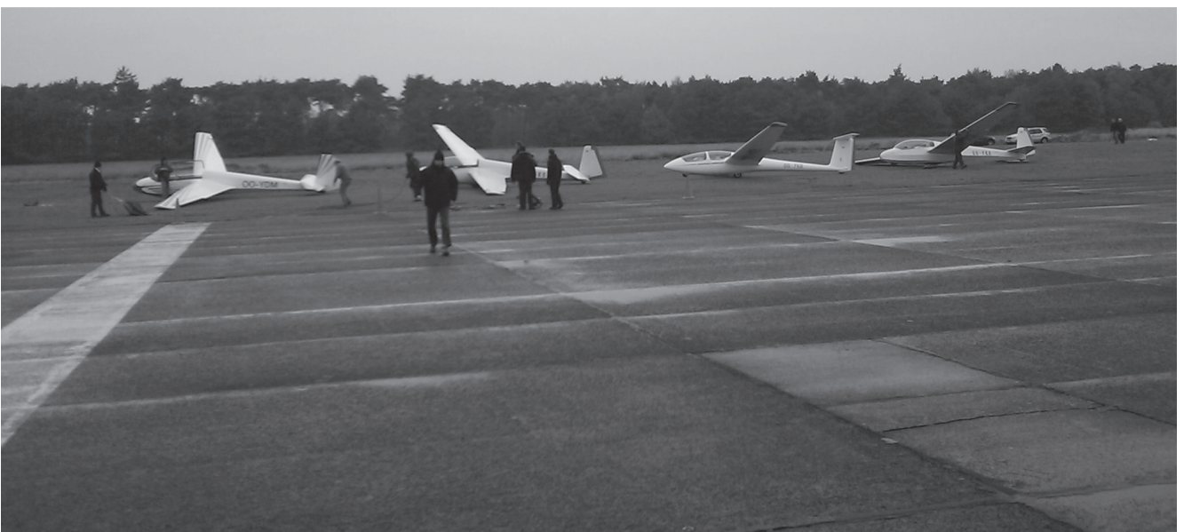
Startlijn voor de lier in Weelde. Binnen minder dan 10 minuten hangen deze 4 toestellen in de lucht...