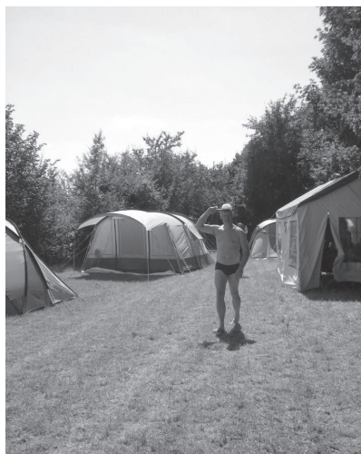
Het kampement van De Wouw...

De camping bevindt zich vlak aan het vliegveld. Deze is opgedeeld in een gedeelte voor de clubleden die er een caravan hebben staan, en een gedeelte voor bezoekers.