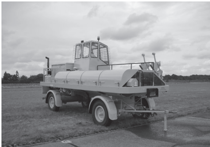
Niet helemaal de nieuwe lier van de KAC, maar een vervangertje...