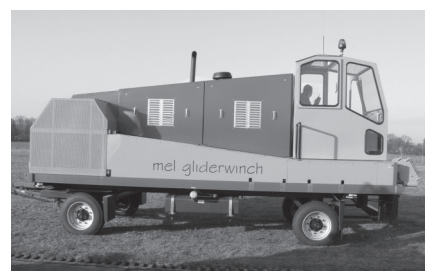
Dit is de nieuwe lier van de KAC..

drie toestellen ter beschikking, anders zouden we allen maximum een start kunnen gemaakt hebben. Twee ASK13 en een ASK21 zodat we aan het totaal van vier toestellen kwamen. En dat is geen toeval, want de nieuwe lier in Weelde bezit vier lierkabels en kan vier toestellen na elkaar optrekken in ongeveer 10