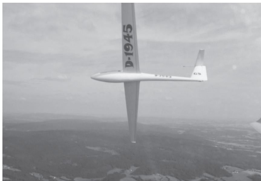
LS 3 klaar met de eerste cumulus